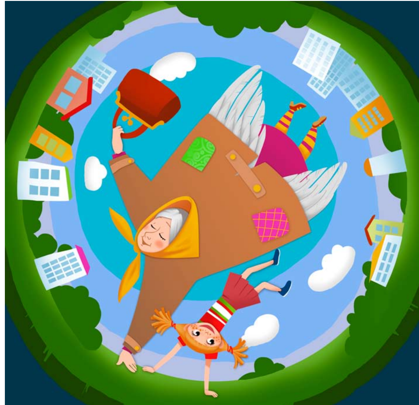
Иллюстрация Елены Быковой

Бабушке кажется, что я очень неосторожна, и она просит меня быть аккуратней. Я обещаю. Когда-нибудь мы будем крутиться вместе. И бабушка поймет, что это не страшно.