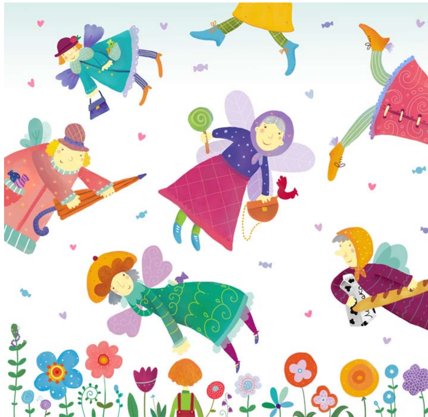
Иллюстрация Маши Сергеевой

В се бабушки умеют летать. Я знаю, я видела. Бабушки летают не высоко, не низко. Так, чтобы можно было погладить своих внуков по голове. У бабушек за спиной есть маленькие крылышки. Как у стрекоз или бабочек. Под косынками бабушки прячут сказки, под шапками – истории, а в карманах у них конфеты. У бабушек в сумочках лежат леденцы и зонтики. Бабушки любят покупать в магазине хлеб и молоко, любят сидеть на лавочке и смотреть на детей. Бабушки не улетают на юг, как птицы. Они всегда остаются дома. Бабушки никогда не обижаются, их можно только огорчить. Когда бабушки расстроены, они не могут летать, только сидят тихонько. Говорят, бабушки могут улететь навсегда. Поэтому бабушек надо беречь. У меня тоже была бабушка. И она умела летать.