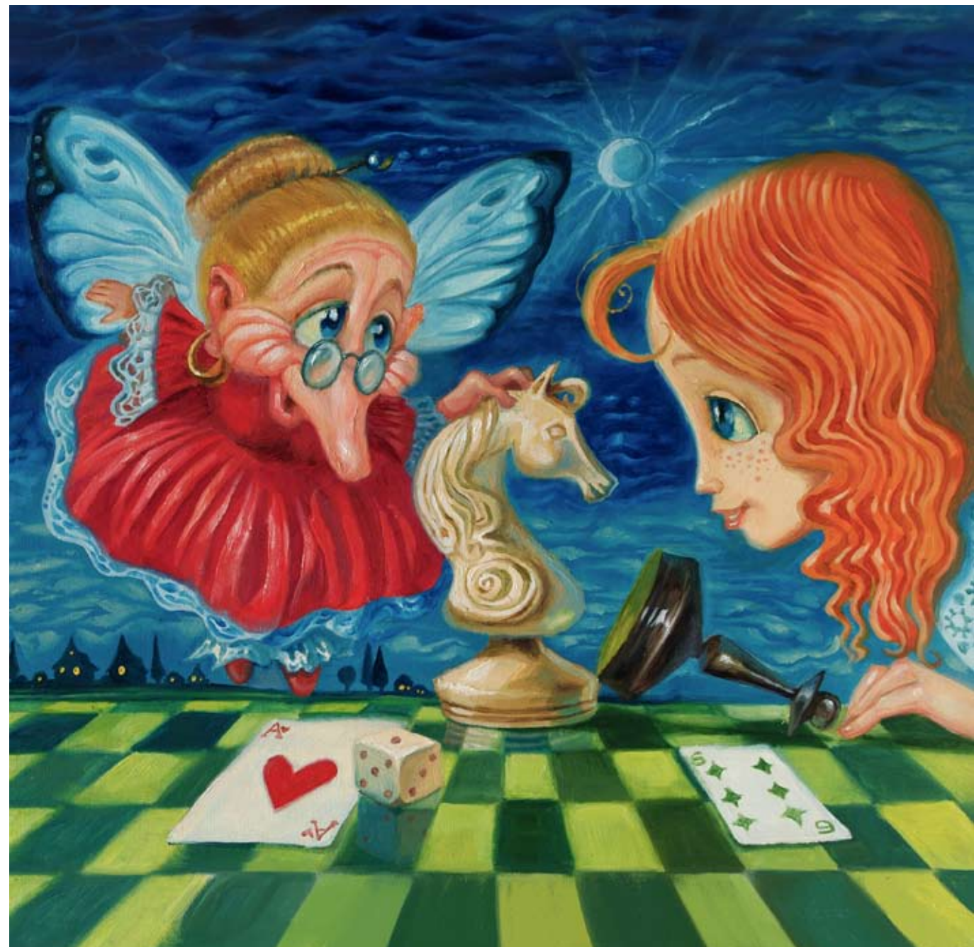
Иллюстрация Макса Ларина

Она никогда не расстраивается, когда проигрывает. Я тоже так хочу, но у меня не получается.