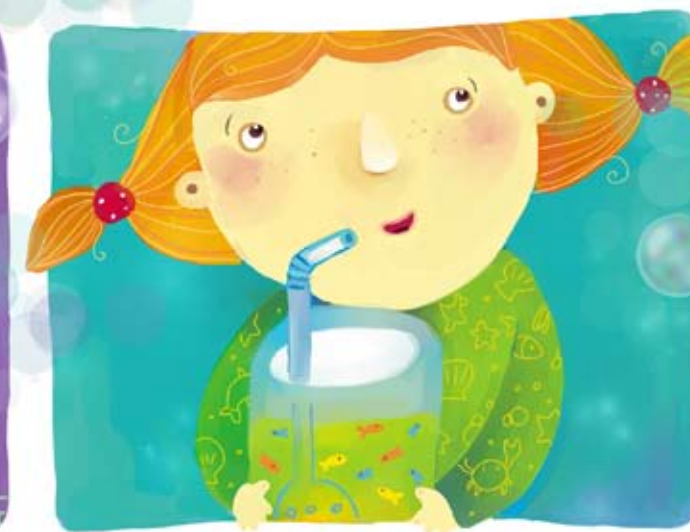
Иллюстрация Маши Сергеевой