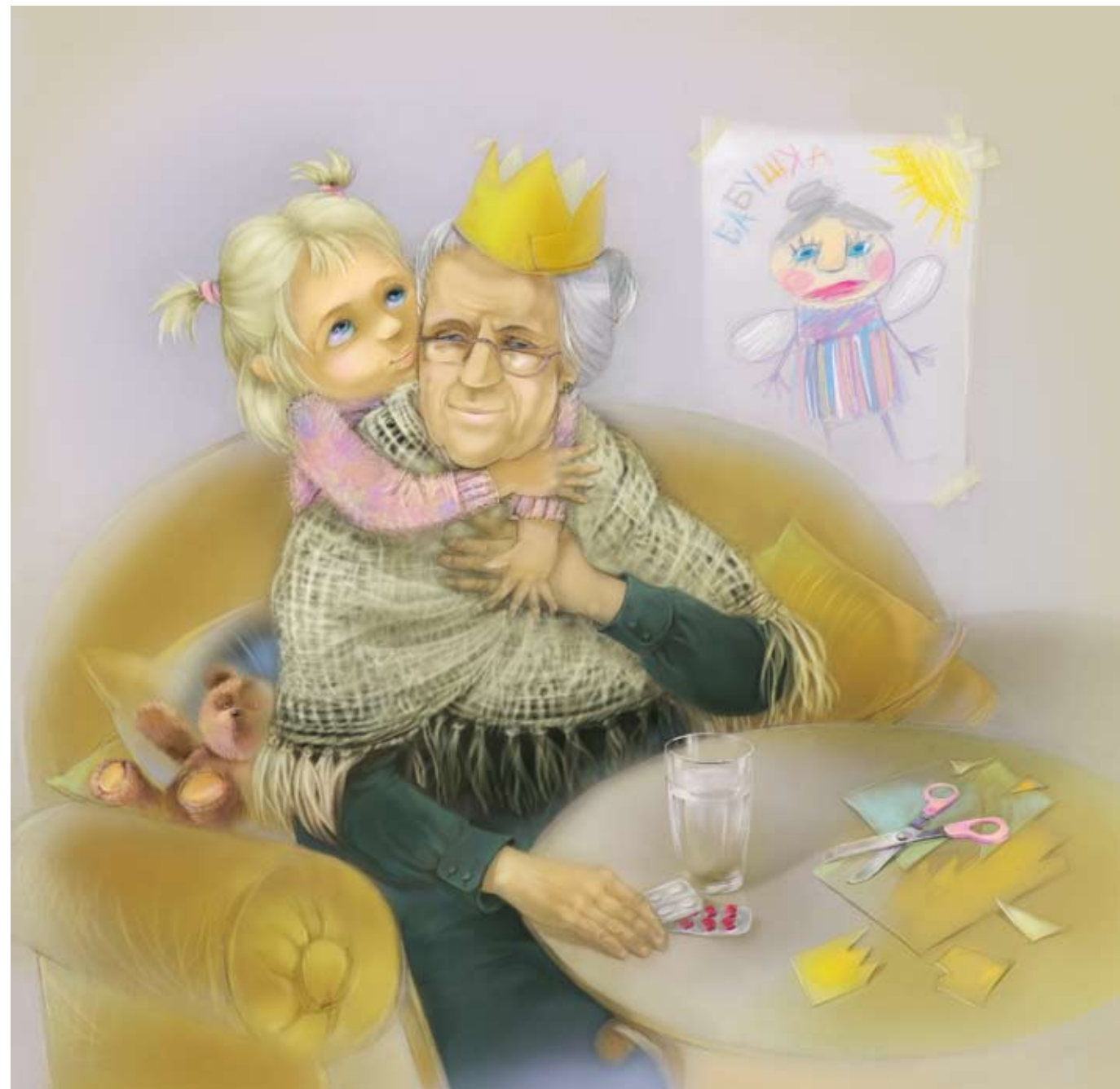
Иллюстрация Светланы Колесниченко