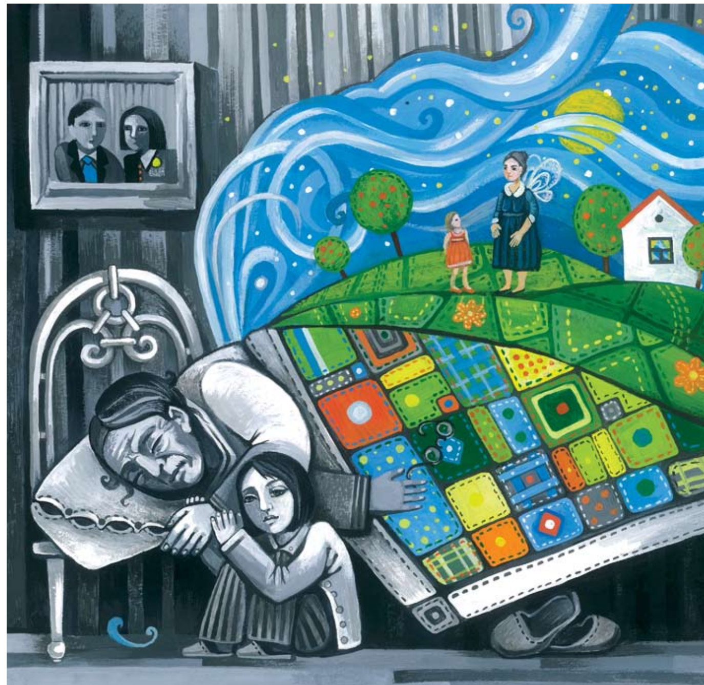
Иллюстрация Polli Sokolok

Я все время думаю о бабушкиных крыльях. Мне хочется спросить у нее об этом. Но бабушка почти ничего не говорит. Мама с папой просят меня держаться. Я не знаю, зачем и за что. Поэтому подхожу к бабушке и беру ее за руку.