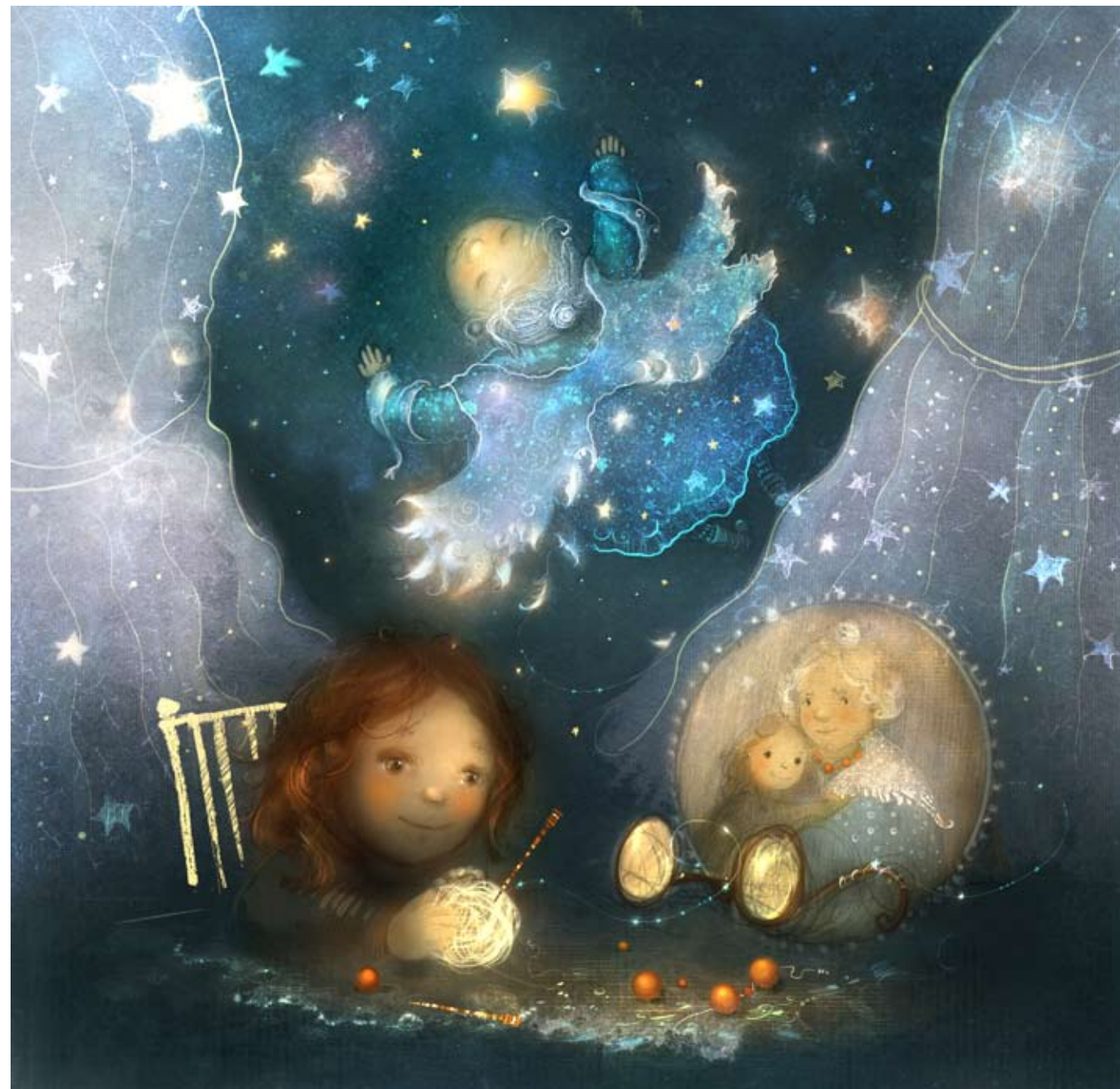
Иллюстрация Полины Яковлевой

Я вижу открытое окно. Значит, бабушка все-таки улетела. Мне становится очень обидно, что она не попрощалась. Но я рада, что ее крылья в порядке.