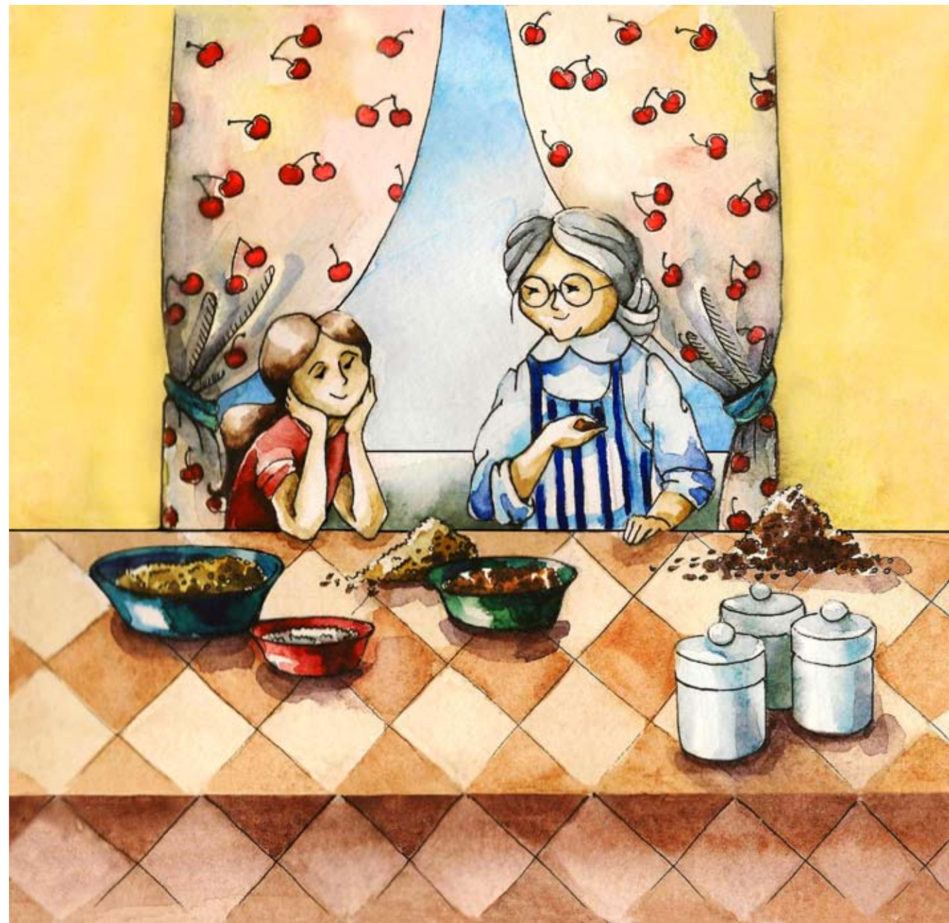
Иллюстрация Дины Архиповой

Она поправляет очки и снова берется за дело. А я сижу и смотрю. Мне тоже не скучно.