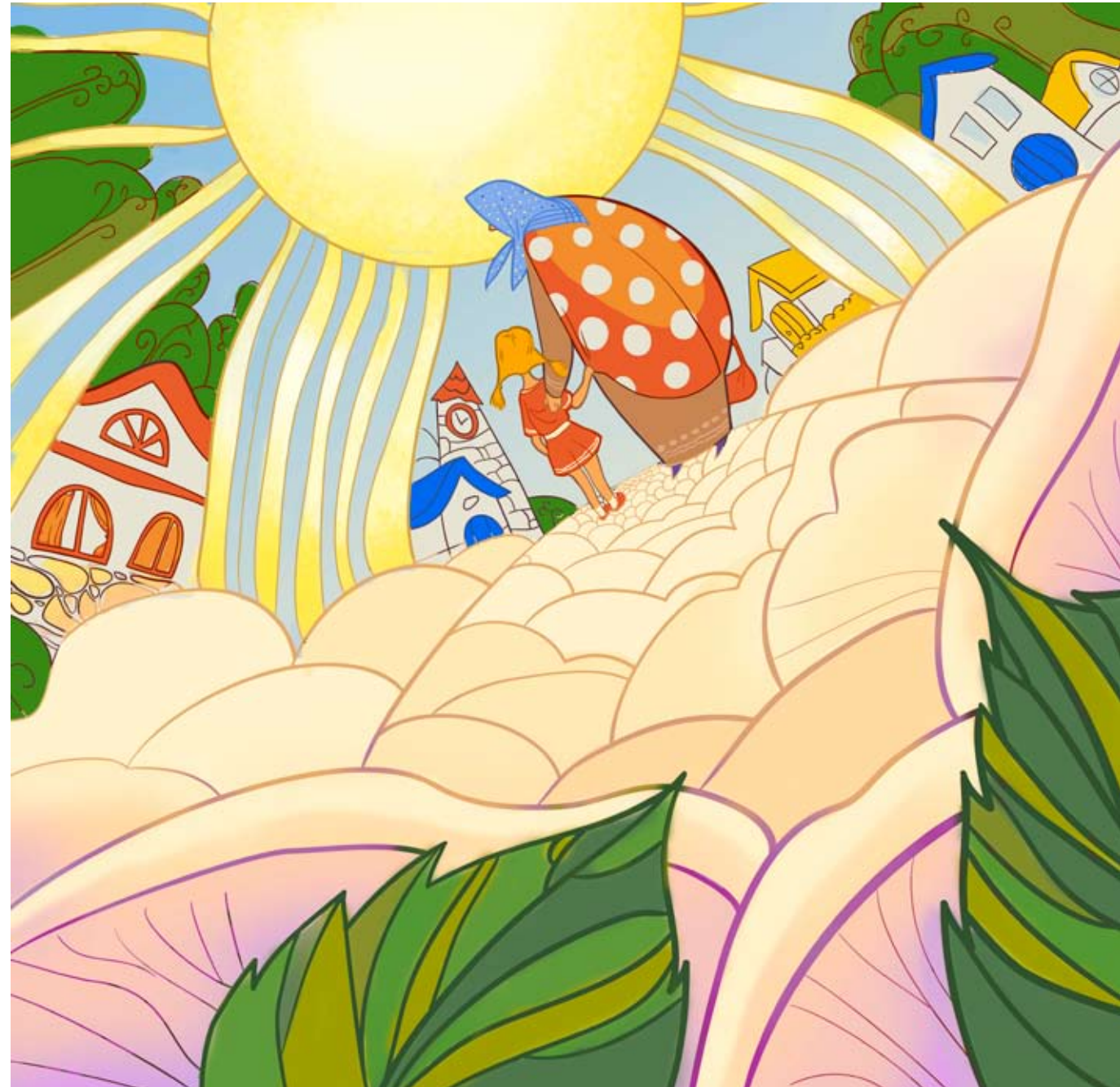
Иллюстрация Елены Быковой

Мне говорили, что когда мы летаем во сне, то растем. Наверное, скоро я перерасту самую высокую гору.