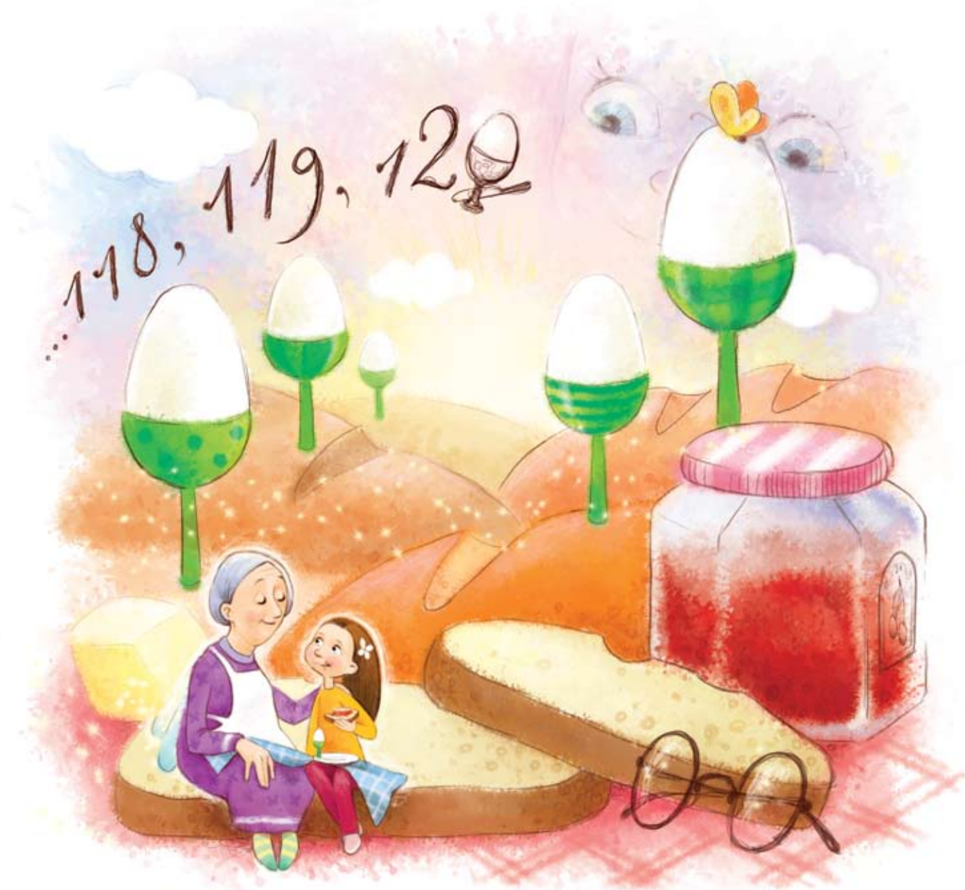
Иллюстрация Гетель Бейзе

— Ты просто лучше режешь, — отвечает бабушка.