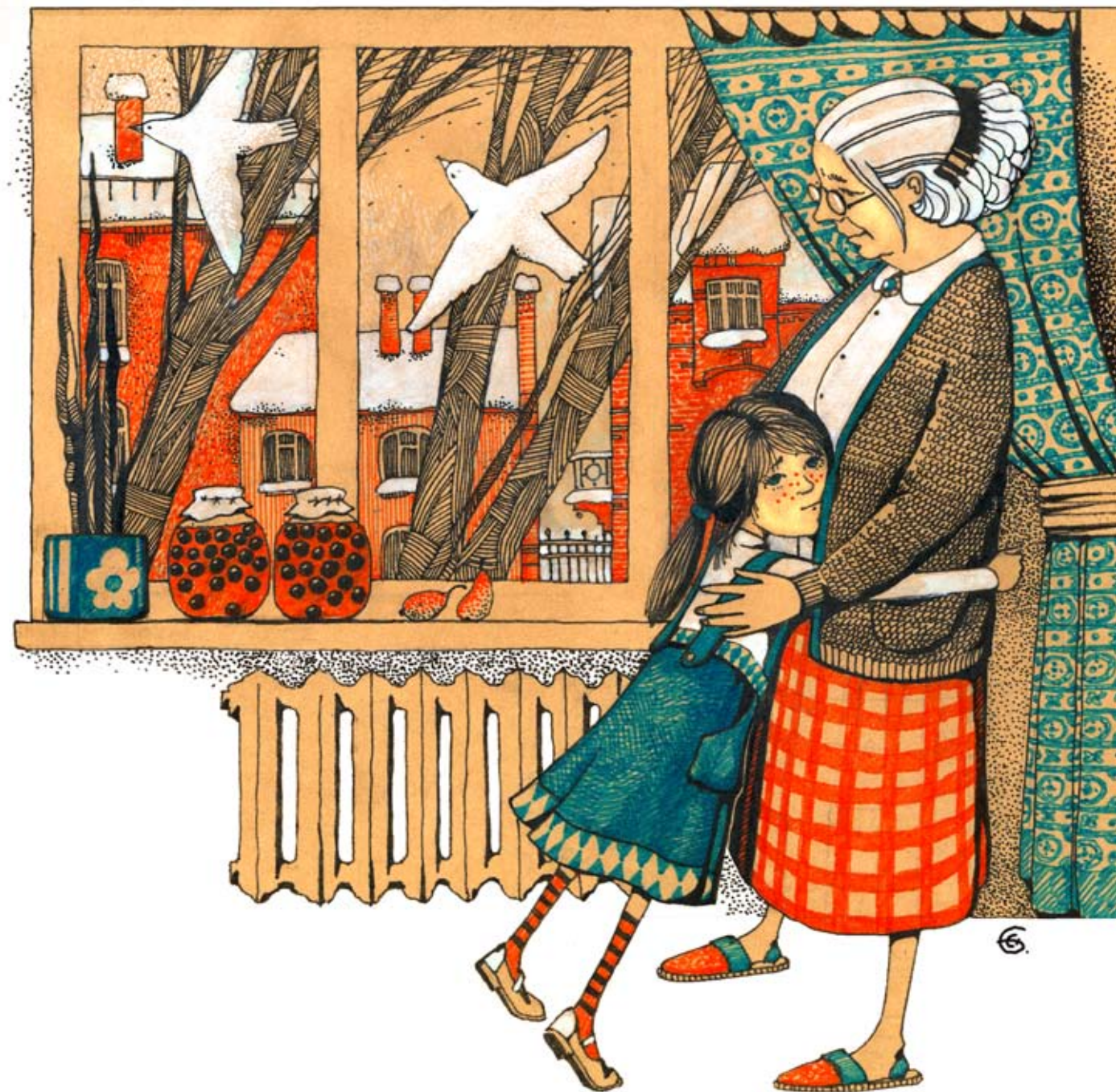
Иллюстрация Екатерины Бауман

Бабушка смеется и говорит, что никогда не оставит меня одну. Я ей верю. Моя бабушка никогда не обманывает.