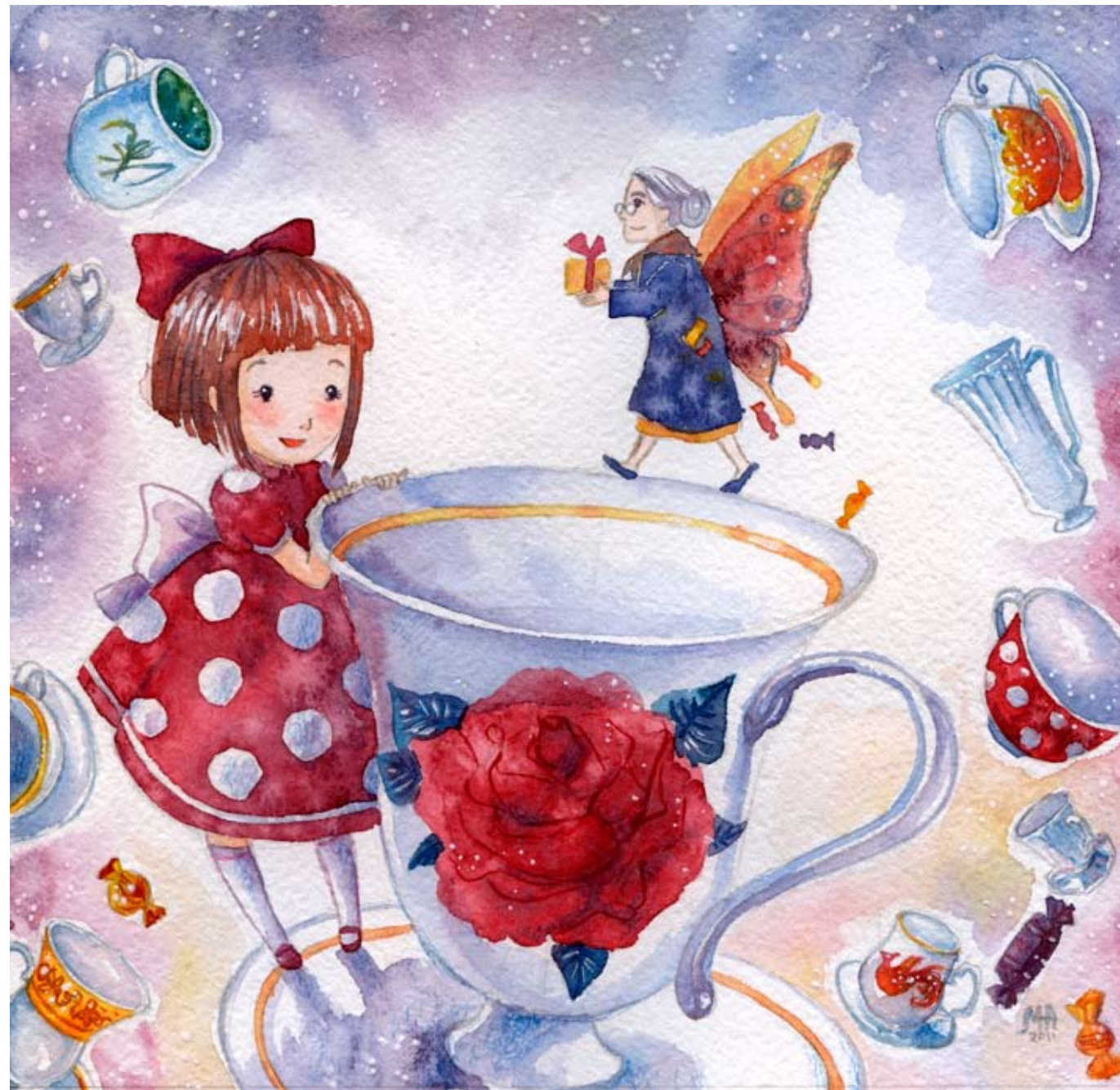
Иллюстрация Анастасии Мазеиной

Я соглашаюсь. Мне нравится моя новая кружка, и я не хочу, чтобы она разбилась.