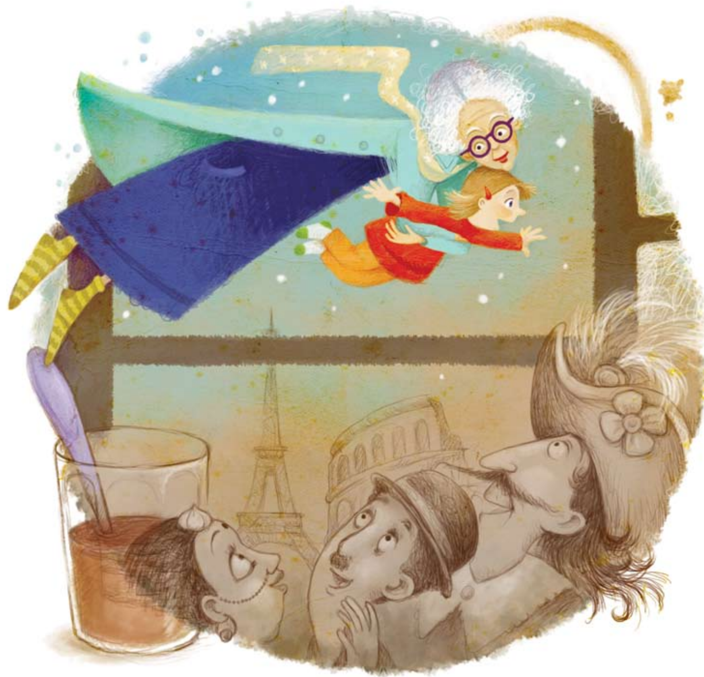
Иллюстрация Гетель Бейзе

Я сажусь рядом и включаю фильм. Бабушка любит смотреть кино. Если бы я могла, я бы сняла фильм про нее.