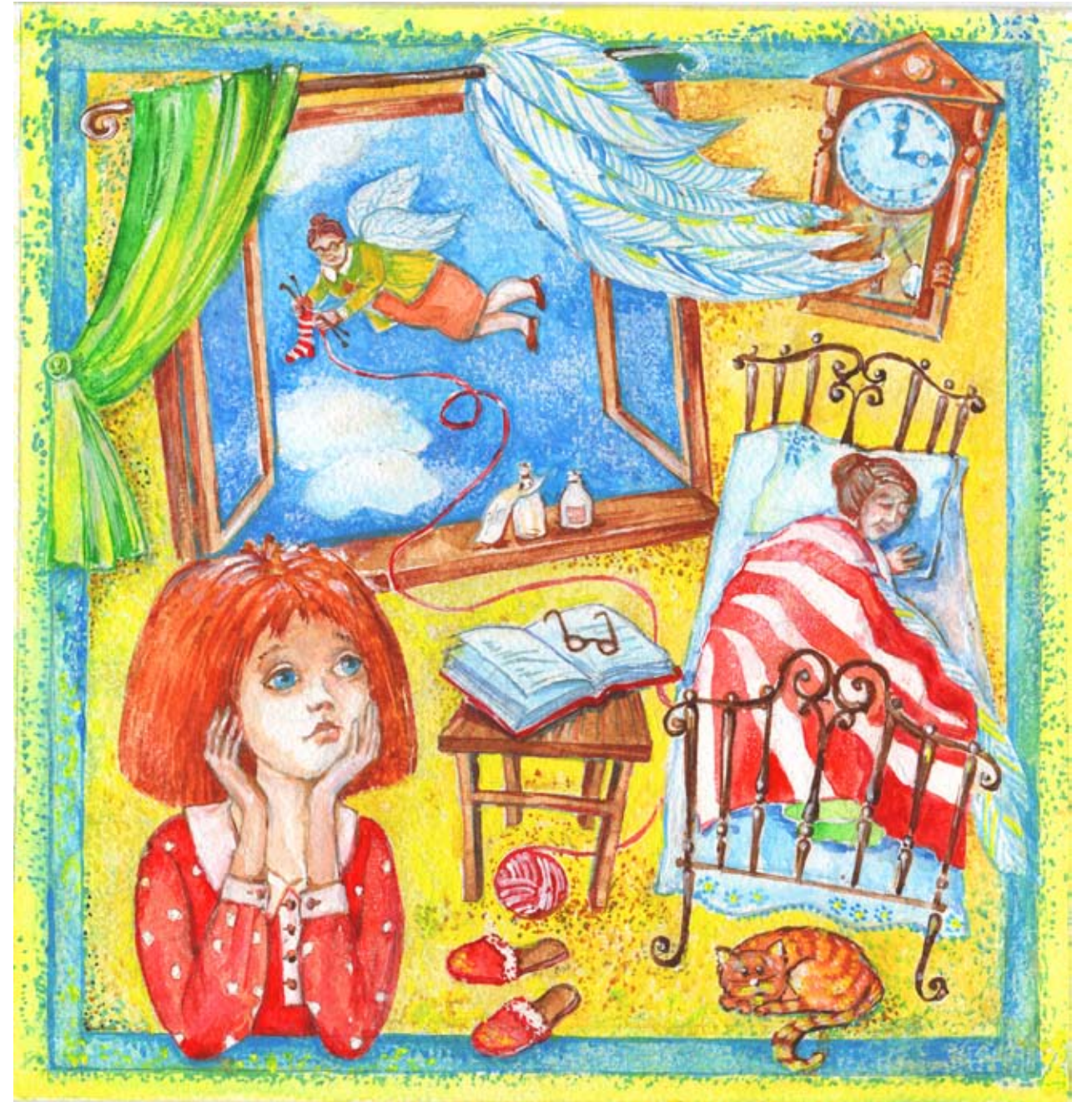
Иллюстрация Ольги Макиевой

Родители меня не понимают. Они не знают, что бабушка умеет летать. Папа обнимает меня и говорит, что нам надо быть вместе. Я тоже его не понимаю.