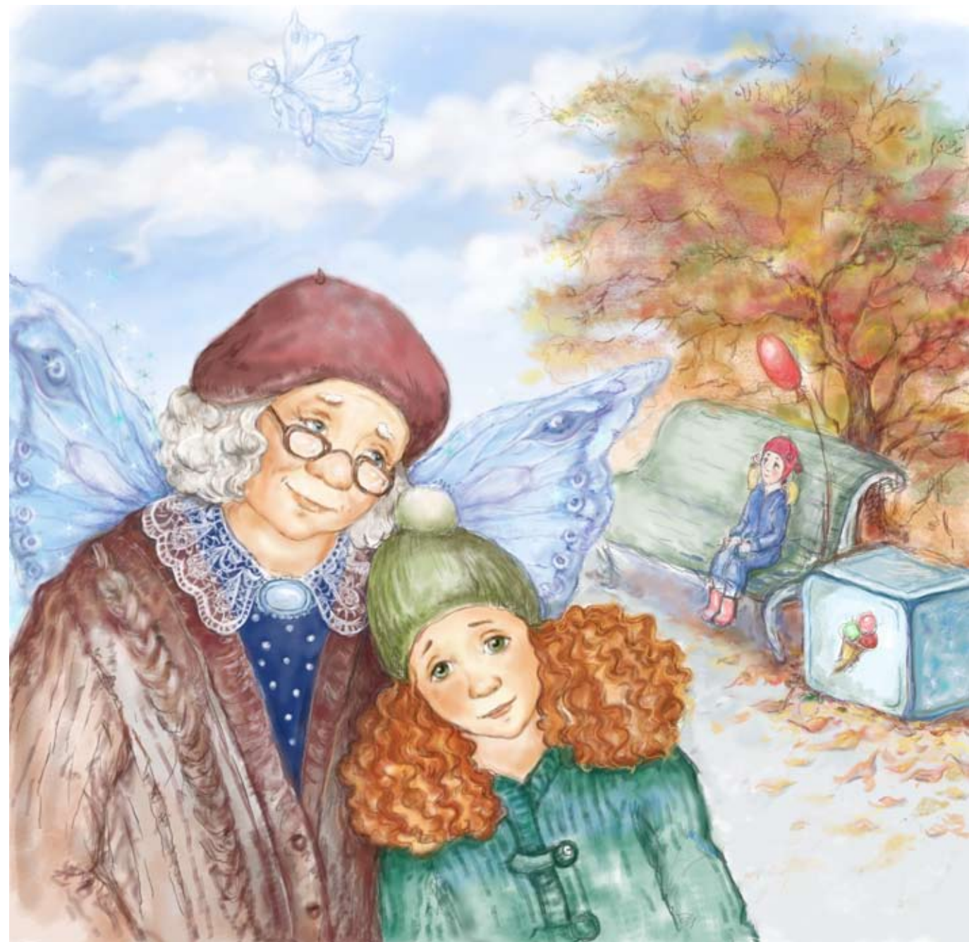
Иллюстрация Татьяны Митрушовой

Бабушка говорит, что со мной всегда будут мама и папа. Я отвечаю, что это не повод улетать. Бабушка не возражает, но я чувствую, как дрожат ее крылья.