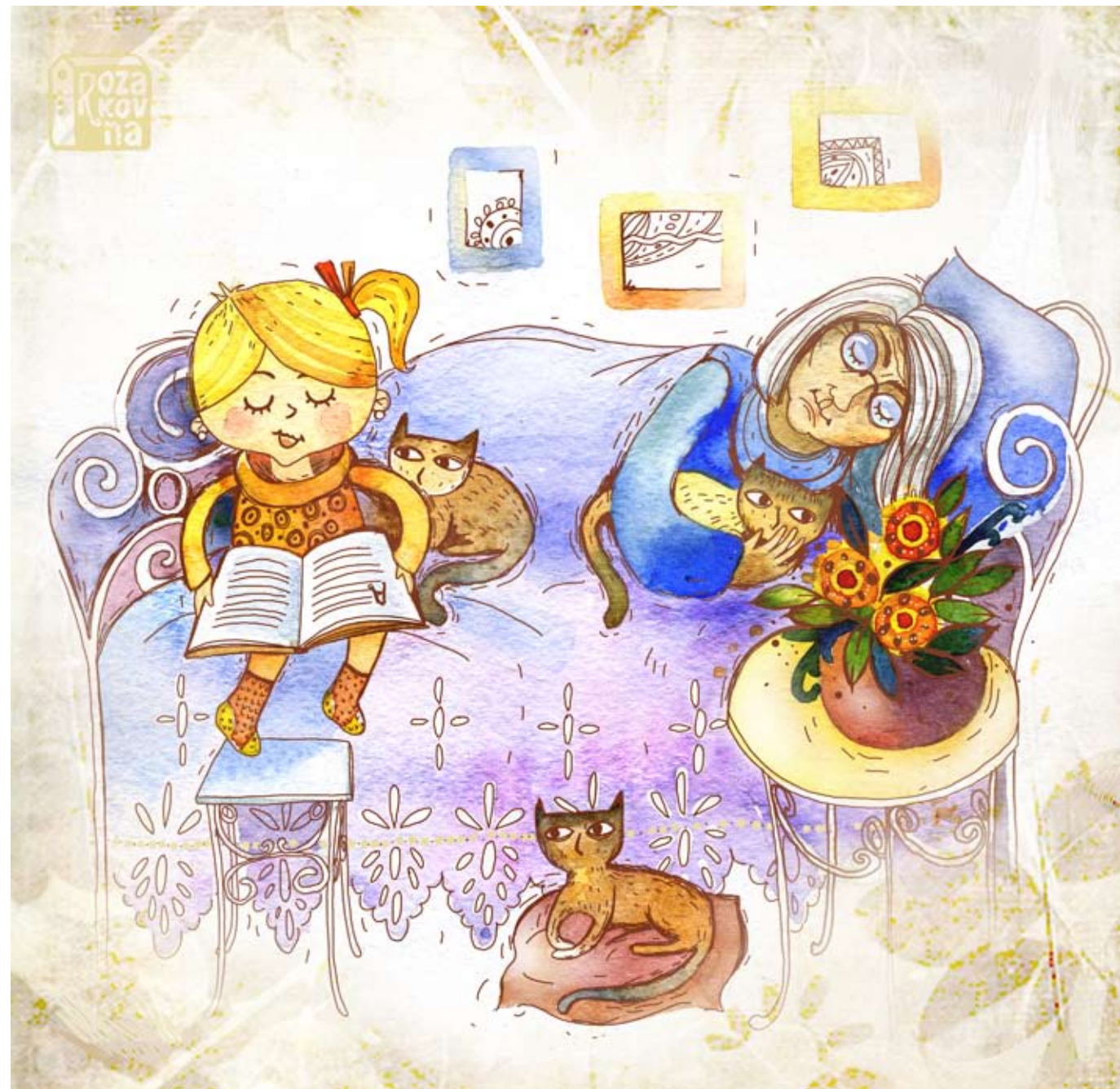
Иллюстрация Ольги Азаровой

Б абушка сильно кашляет и папа делает ей теплое молоко. Я добавляю в него ложку меда, который когда-то собрала бабушка. Бабушке становится лучше. Надо почаще приносить ей медовую воду.