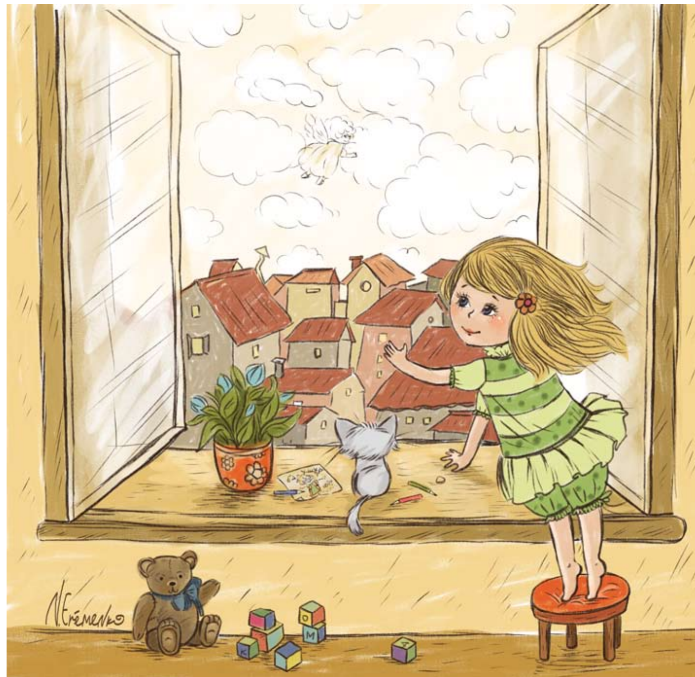
Иллюстрация Анастасии Ерёменко