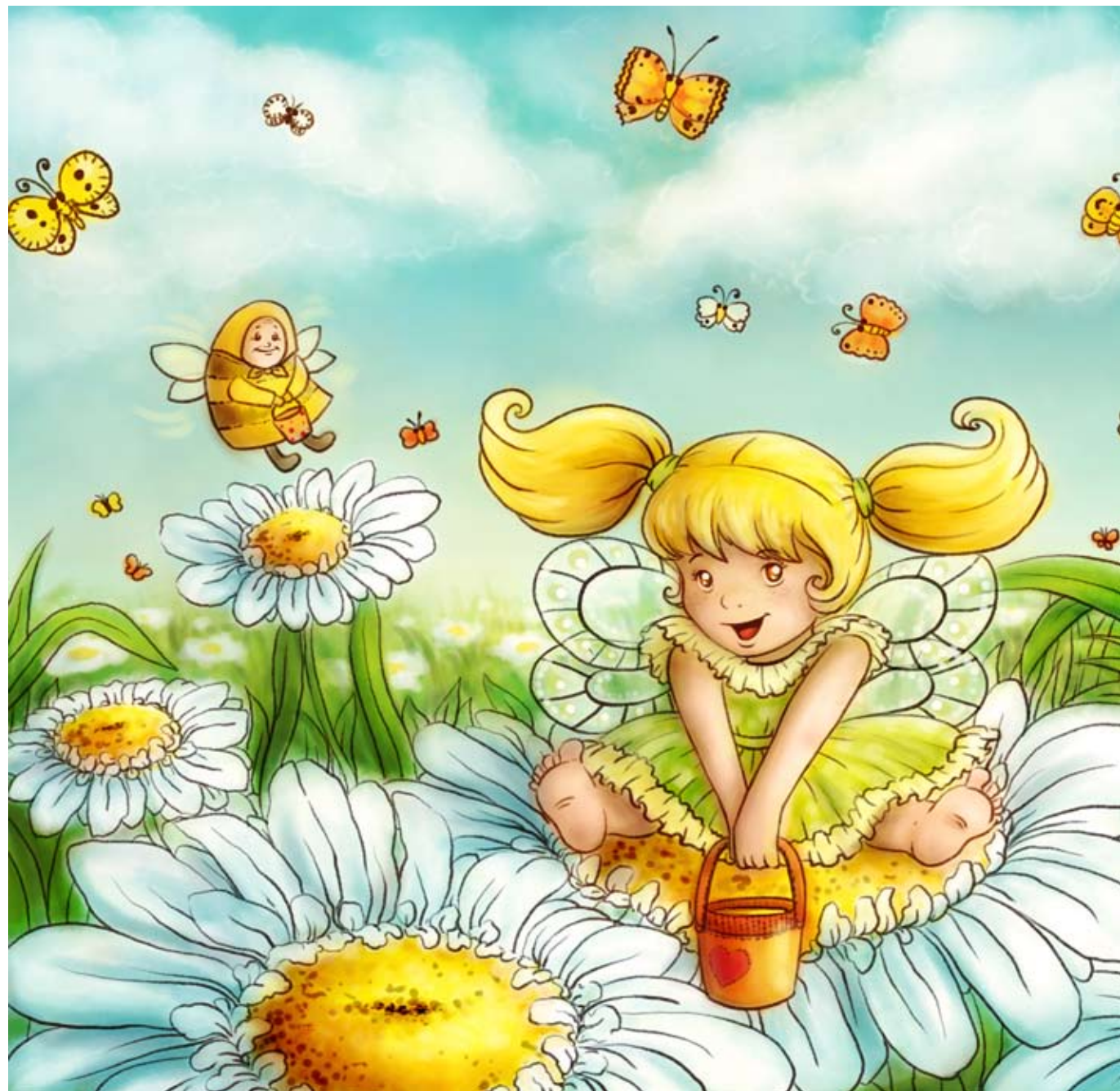
Иллюстрация Иры Новиковой

Я говорю об этом бабушке. Она наливает нам чай и обещает как-нибудь взять меня с собой.