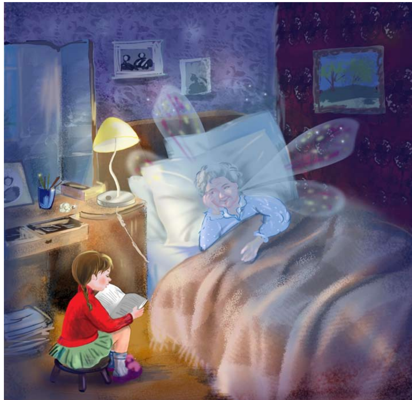
Иллюстрация Соны Адалян

М ама с папой сказали, что бабушке надо больше лежать. Это хорошо для ее здоровья. Теперь я сижу рядом с ней. Я очень переживаю, что ее крылья могут помяться и она не сможет больше летать. Бабушка видит мое волнение и говорит, чтобы я ей почитала. Я беру с полки «Карлссона». Он тоже умеет летать.