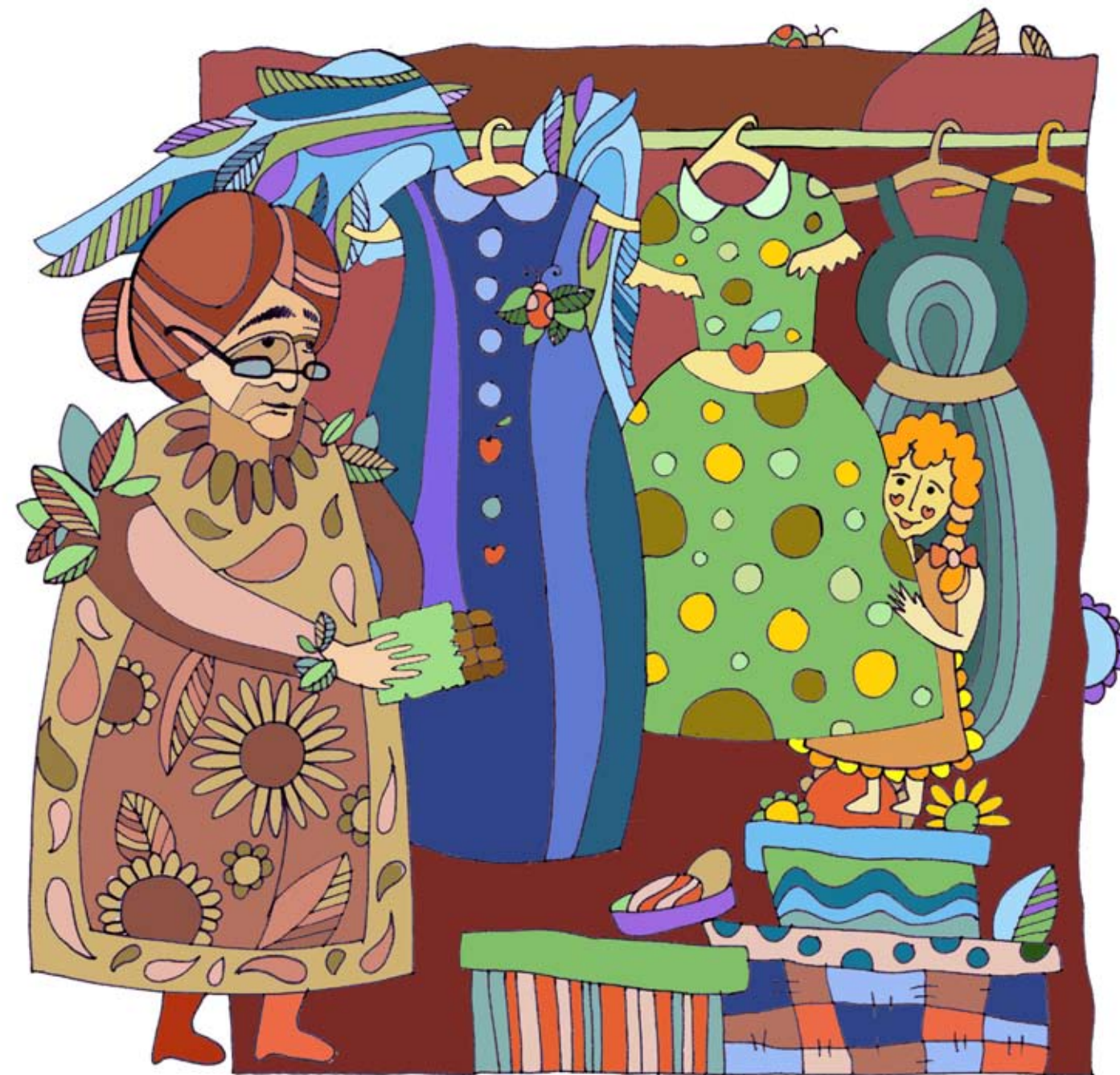
Иллюстрация Жанны Мендель

У бабушки много платьев. Ее любимое — темно-синее, с брошкой. Наверное, потому, что оно просторное и в нем хорошо помещаются крылья. А мне нравится то, что в горошек. Бабушка редко его надевает. Но я часто в нем прячусь, когда мы играем в прятки. Бабушка всегда меня находит. А я никогда не могу найти ее шоколад.