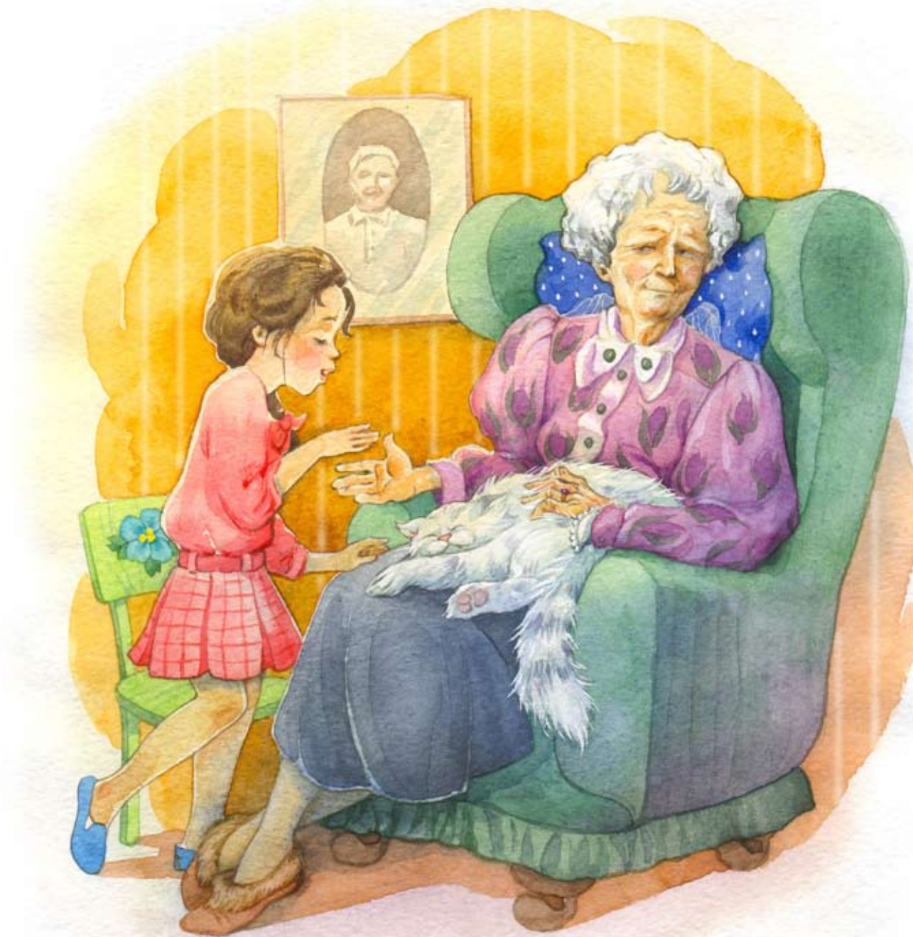
Иллюстрация Елены Володькиной

У бабушки очень сильные руки. Кажется, даже сильнее, чем папины. Иногда я сажусь рядом с ее креслом, она подставляет мне ладонь, и я слегка ударяю по ней рукой. Бабушка сжимает кулак, пытаясь поймать мои пальцы. Когда ей это удается, я чувствую, какая она сильная.