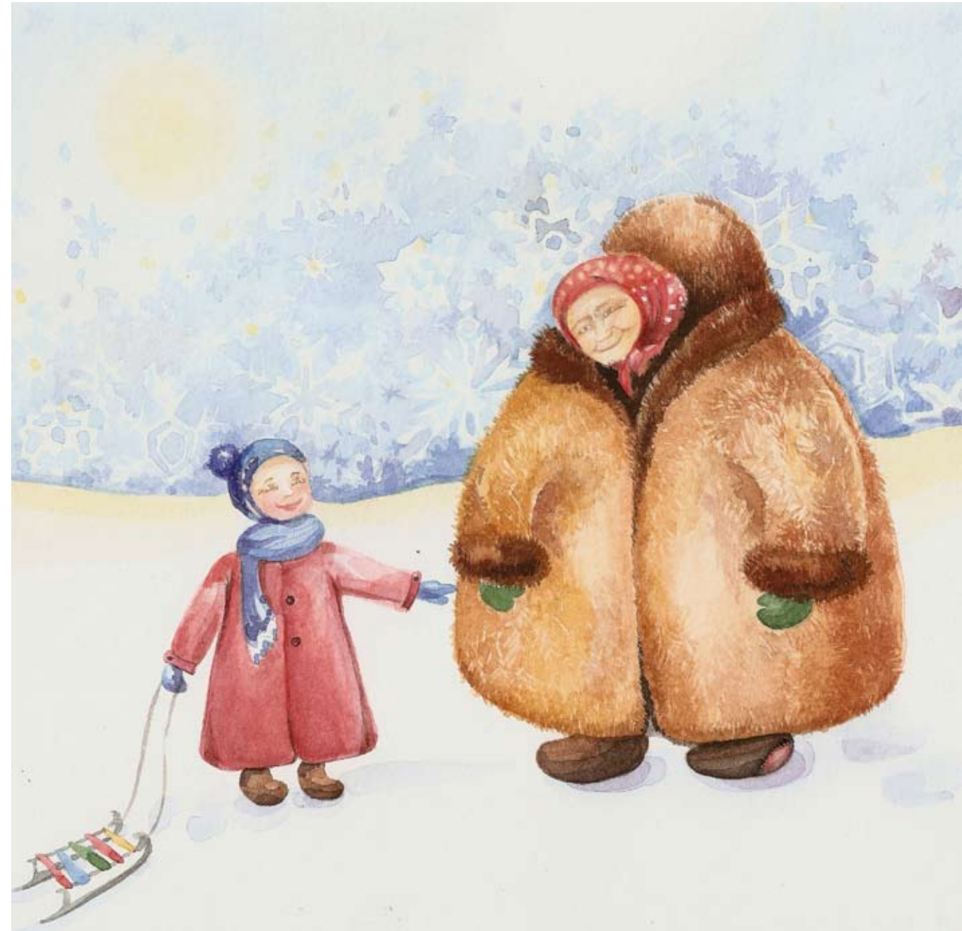
Иллюстрация Евгении Ким

— Я тут, — отзывается бабушка откуда-то изнутри и тоже смеется.