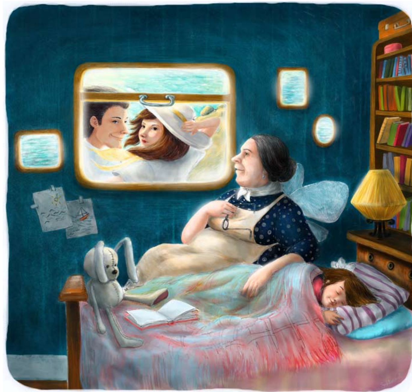
Иллюстрация Лизы Третьяковой

Бабушка садится рядом и берет меня за руку. Она рассказывает мне о том, как была молодой и ездила с дедушкой на море. Я слышу шум волн и засыпаю под теплый звук ее голоса.