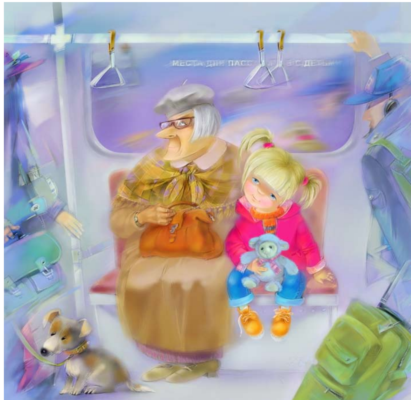
Иллюстрация Светланы Колесниченко