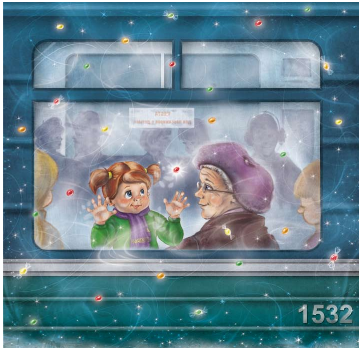
Иллюстрация Любви Тярасовой