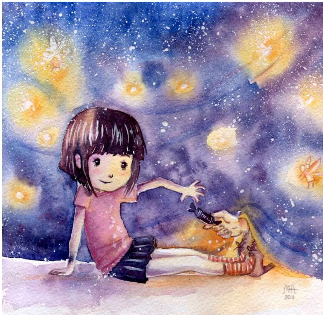
Иллюстрация Анастасии Мазеиной

Я знаю, что она принесет мне конфету, и не выхожу. Полы скатерти отодвигаются, и я вижу серебристый фантик. У конфеты «Ласточка» вкус полета. Я кусаю ее ровно три раза. Когда я съем тысячу таких конфет, у меня вырастут крылья. Это двадцатая.